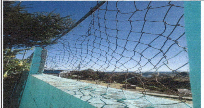
FOTO 2: SE ENCUENTRA EN MAL ESTADO LA CIRCULACION COMPLETA DEL ESTABLECIMIENTO.