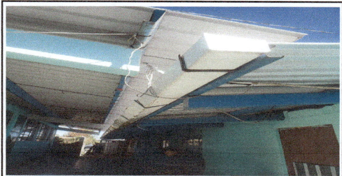
CANAL: DETERIORADO POR EL TIEMPO.

Observación: Si es necesario se pueden agregar hojas adicionales y actualizar el número de hojas.